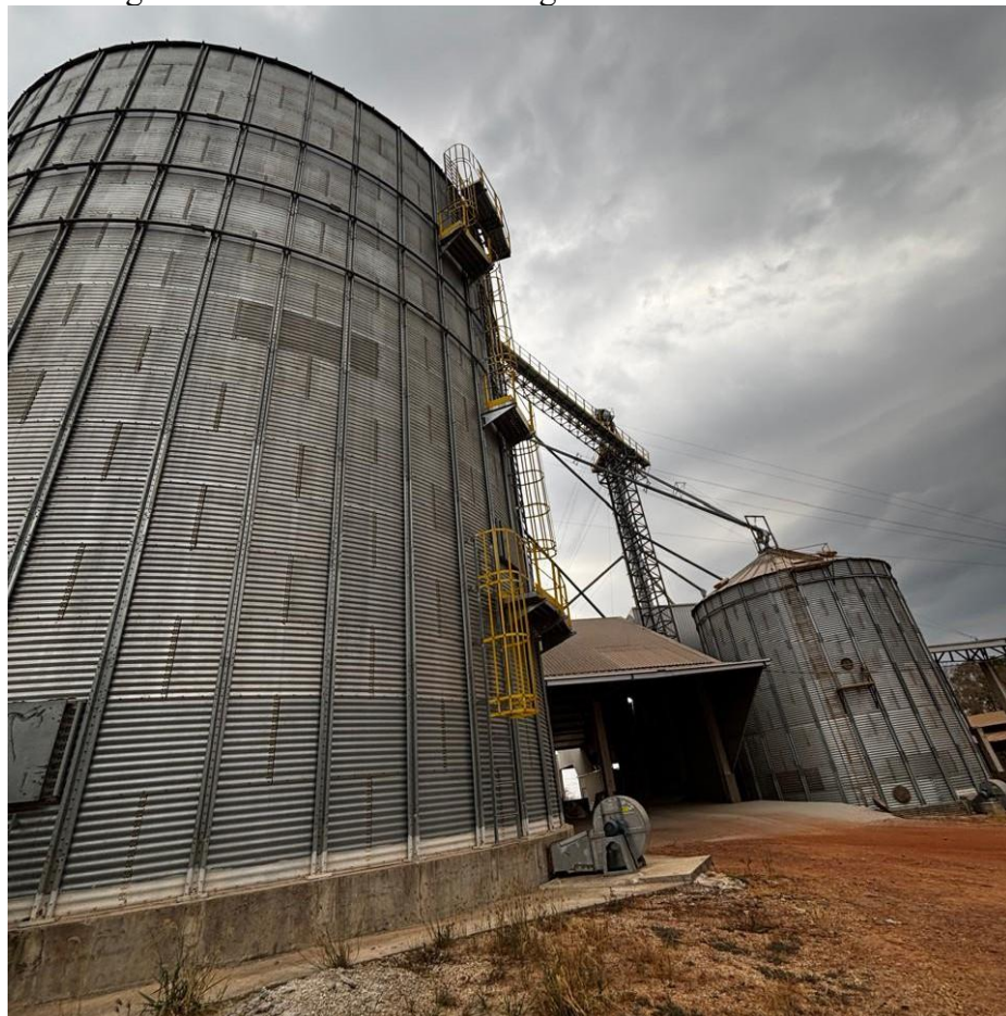
Figura 1 - Vista geral da unidade de armazenagem da Fazenda São Camilo.

O entrevistado relatou que possibilidade de uma ampliação da capacidade é limitada pelos altos custos de implantação, ressaltando que a fundação de um novo armazém pode custar milhões de reais. A expansão depende diretamente de políticas de crédito e apoio governamental.